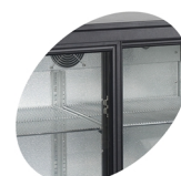
Zarážka dveří pro bezpečnou nakládku

Minibar s dvěma prosklenými posuvnými dveřmi, barva černá