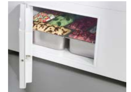
Storage cell Cella di riserva