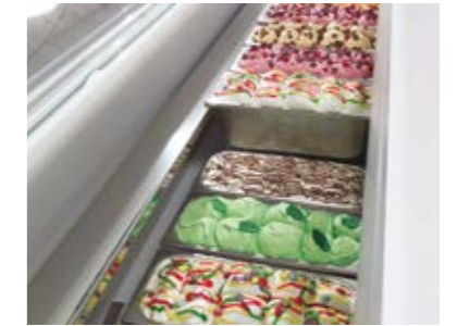
Display - piled up double row - 5 Lt Vasca espositiva - doppia fila di riserva - 5 Lt